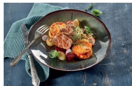
Sweet Potato Gratin