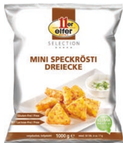
Mini spekroesti driehoekjes

Snack en maaltijdcomponent. Snel te bereiden.